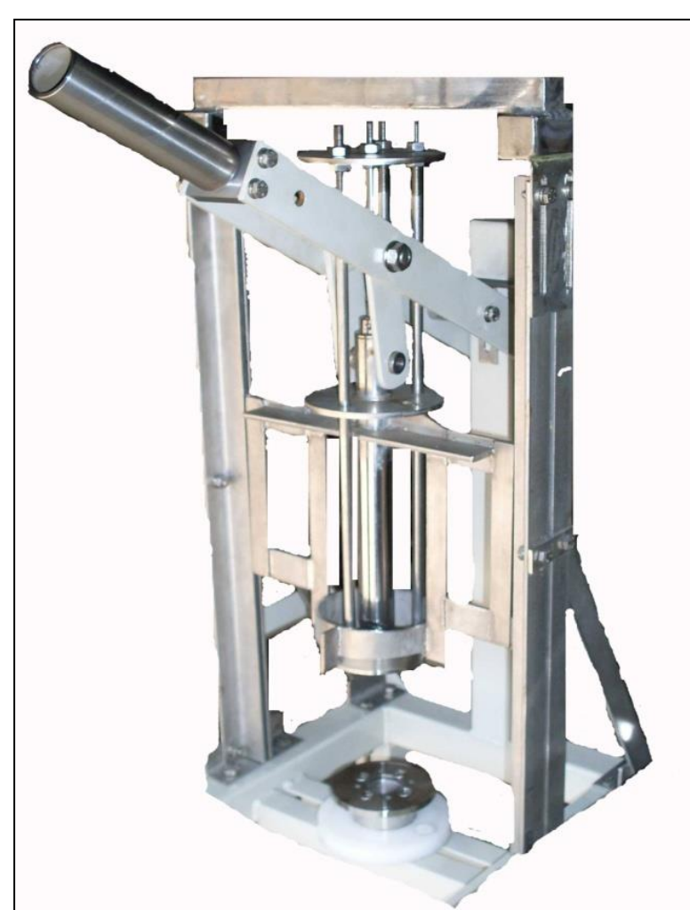
Peeler and Corer